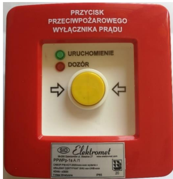
Ryc. 1. Ręczny przycisk przeciwpożarowego wyłącznika prądu typu PPWP TYP A (PPWPp-1s A/1)