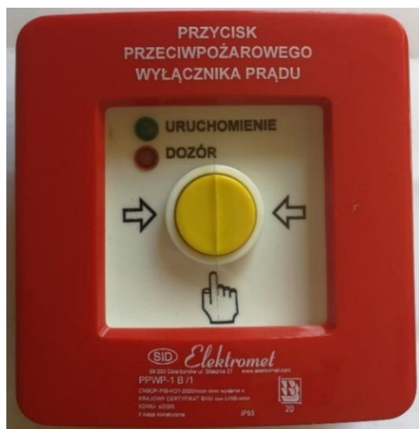
Ryc. 2. Ręczny przycisk przeciwpożarowego wyłącznika prądu typu PPWP TYP B (PPWP-1 B/1)